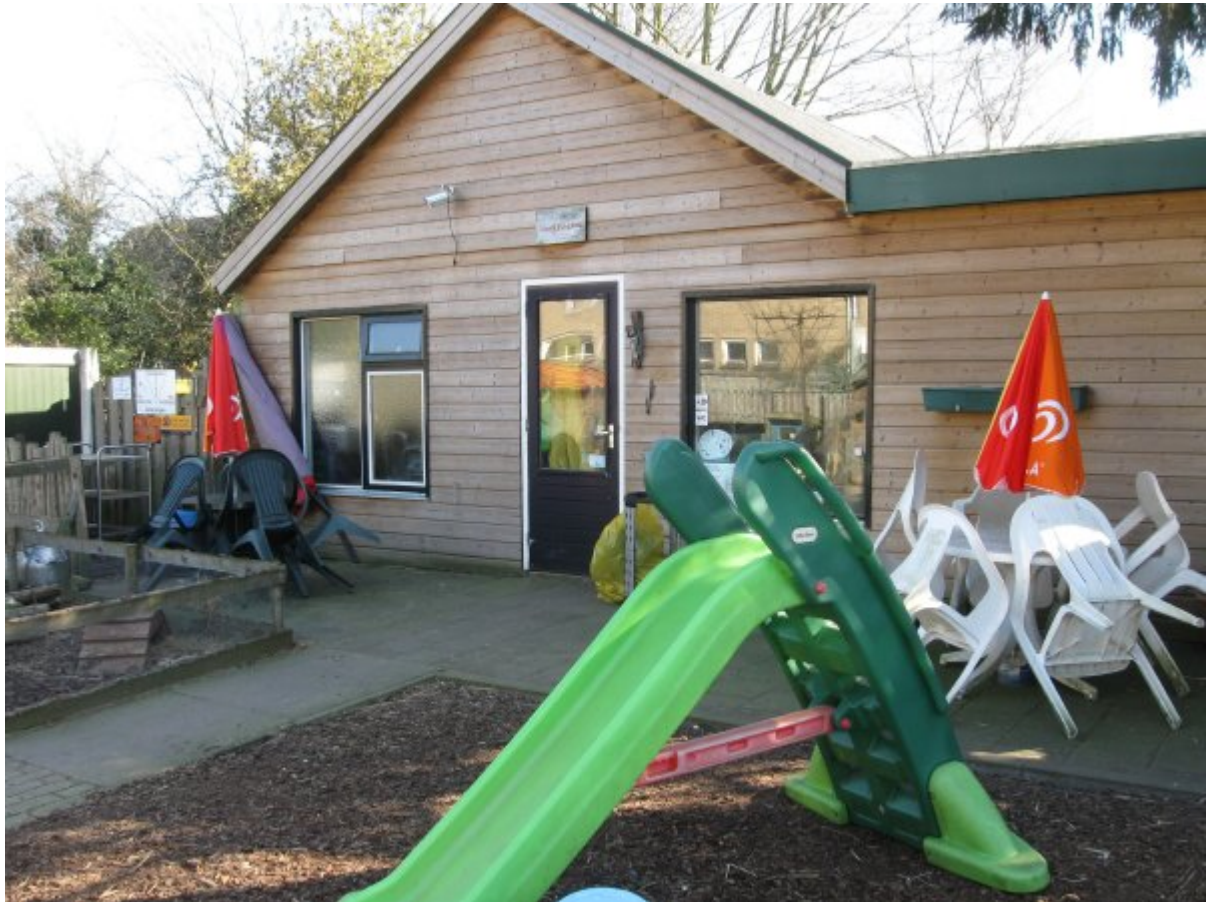
Een speelveldje voor de kinderen.