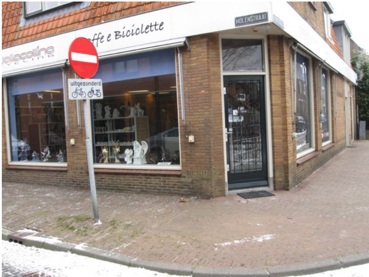
Nieuwe winkel in de Overstraat nu open.