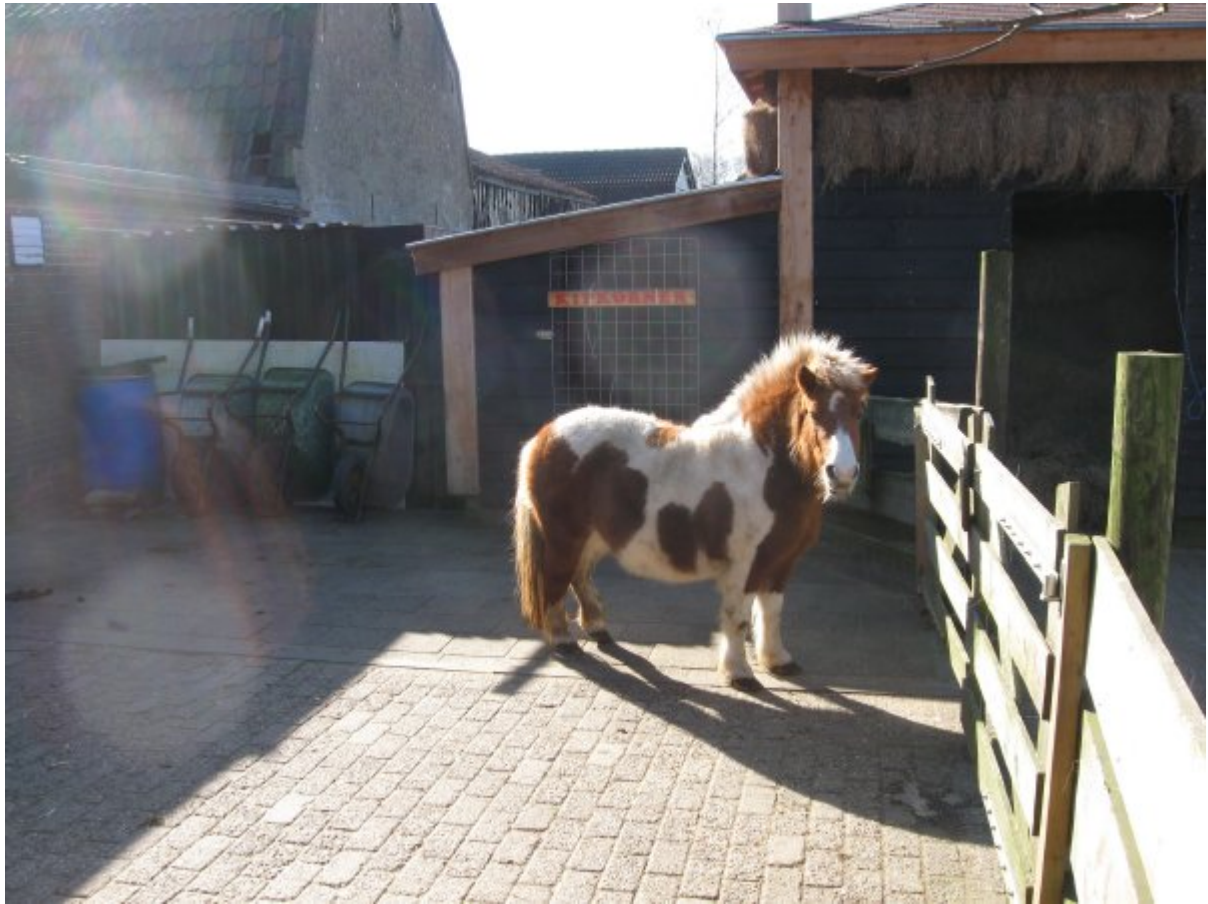
Het paardje groet u!